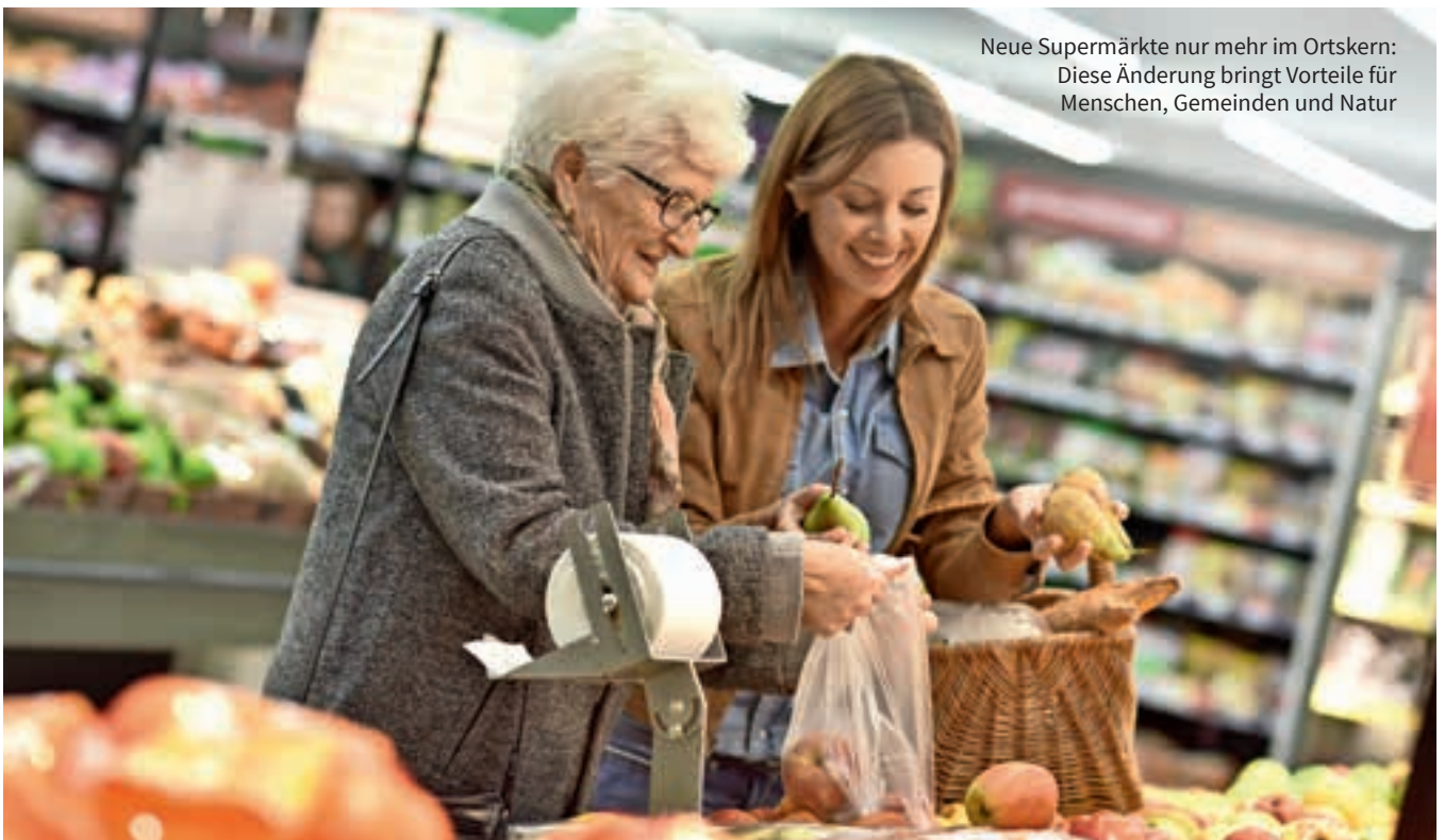
Neue Supermärkte nur mehr im Ortskern: Diese Änderung bringt Vorteile für Menschen, Gemeinden und Natur