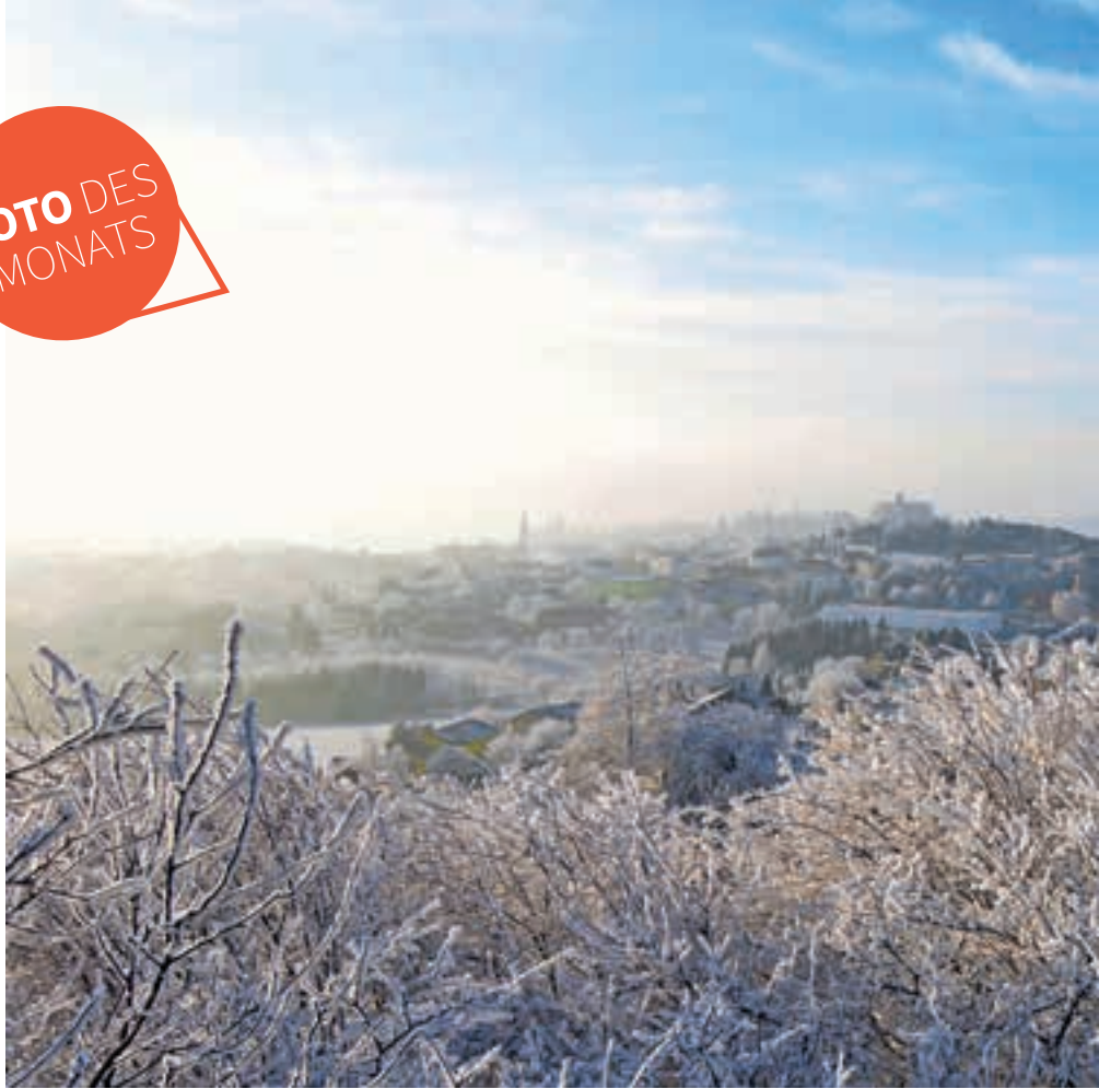
FOTO DES MONATS