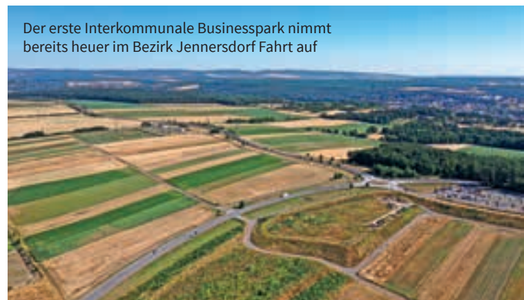
Der erste Interkommunale Businesspark nimmt bereits heuer im Bezirk Jennersdorf Fahrt auf