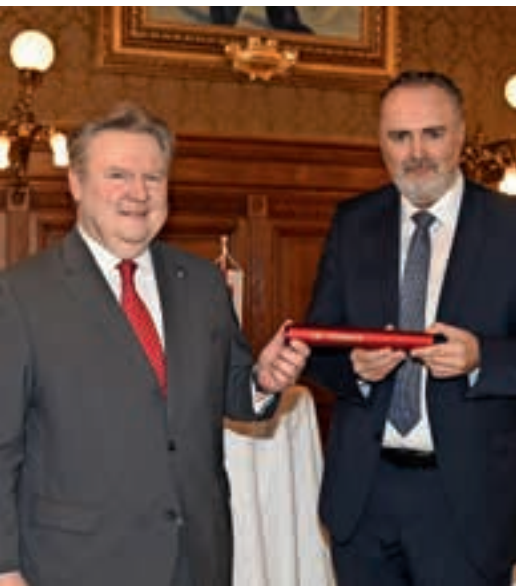
Wiens Bürgermeister Ludwig übergibt den Taktstock an LH Doskozil