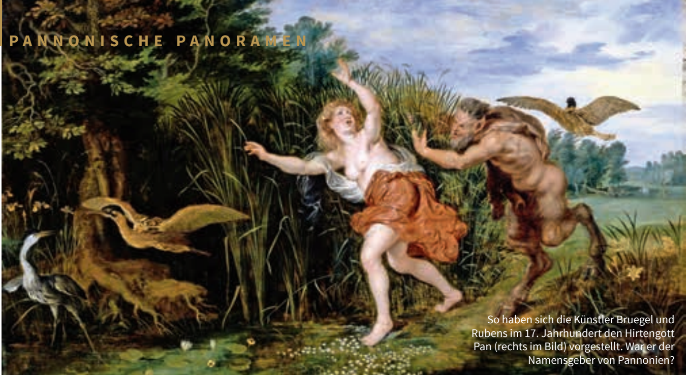
So haben sich die Künstler Bruegel und Rubens im 17. Jahrhundert den Hirtengott Pan (rechts im Bild) vorgestellt. War er der Namensgeber von Pannonien?