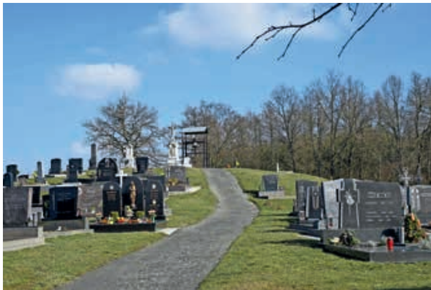
Planmäßig hätte die Grenze zwischen Österreich und Ungarn mitten durch den gemeinsamen Friedhof von Luising und Hagensdorf verlaufen sollen. Nach einer Entscheidung der Grenzfestsetzungskommission des Völkerbundes kam Luising aber im Jänner 1923 doch noch zu Österreich

Erst im Herbst 1921 kam es zu einer Kompromisslösung: Die bewaffneten ungarischen Einheiten zogen ab, Österreich stimmte im Gegenzug einer Volksabstimmung in Ödenburg und acht benachbarten Gemeinden zu. Im Dezember 1921 wurde unter bis heute fragwürdigen Umständen abgestimmt. Das offizielle Ergebnis: 72,8 Prozent waren in Ödenburg für einen Verbleib bei Ungarn. Die ande-