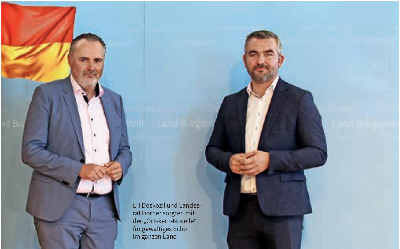
LH Doskozil und Landesrat Dorner sorgten mit der „Ortskern-Novelle“ für gewaltiges Echo im ganzen Land

dass Supermärkte – ebenso Einkaufszentren mit Lebensmitteln und anderen Waren des täglichen Bedarfs – nur mehr im Ortskern des jeweiligen Orts errichtet werden dürfen. Landeshauptmann Doskozil: „Mit dieser Maßnahme leisten wir ganz im Sinne des Regierungsprogramms wichtige Arbeit für das Burgenland, von der alle profitieren, Bevölkerung, Wirtschaft und Umwelt.“