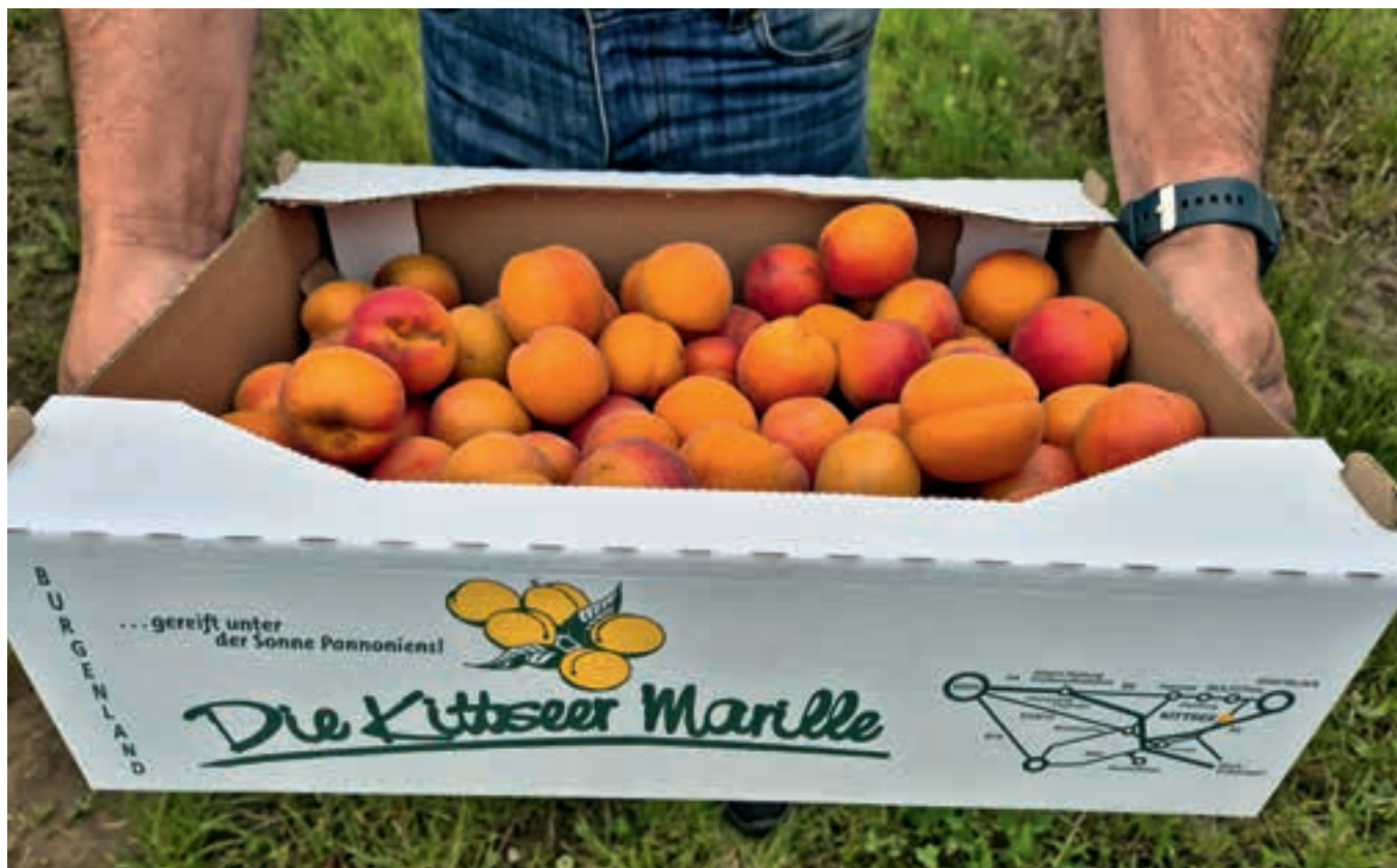
Ein paar Wochen lang sind in Kittsee alle mit der Marillenernte beschäftigt

malerweise Mitte Juni, wenn die Früchte vollreif und besonders aromatisch sind. Und damit ist die Kittseer Marille auch die erste Marille in Österreich, die reif wird.