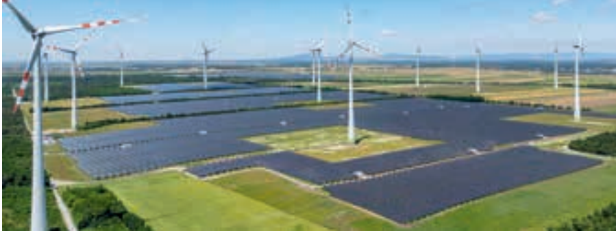
Beeindruckend: der PV-Park in Nickelsdorf