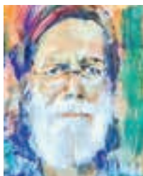
Der Autor und Journalist Wolfgang Weisgram schreibt auf dieser Seite über kleine und große Beobachtungen aus der pannonischen Welt

Aber das sind Überbleibsel. Einst gab es in allen Dörfern mehrere solcher Wirtshäuser. Demnächst in vielen gar keines mehr. An den Wirtshäusern vollendet sich, was vor Jahrzehnten schon begonnen hat mit den Greißlern: die Dorfverwüstung. Bald gab es auch immer weniger Handwerksbetriebe. Bäckereien schlossen, Fleischhauer, wenig später auch die Postämter, die Gendarmerieposten, Bahnhöfe samt angeschlossenen Restaurationsbetrieben. Dann wurden Vereinsheime eingerichtet. Die Sänger singen nun nicht mehr im Extrazimmer; der Musikverein und sogar die Feuerwehr tagt nun gewissermaßen im Eigenheim. Und so weiter und so fort.