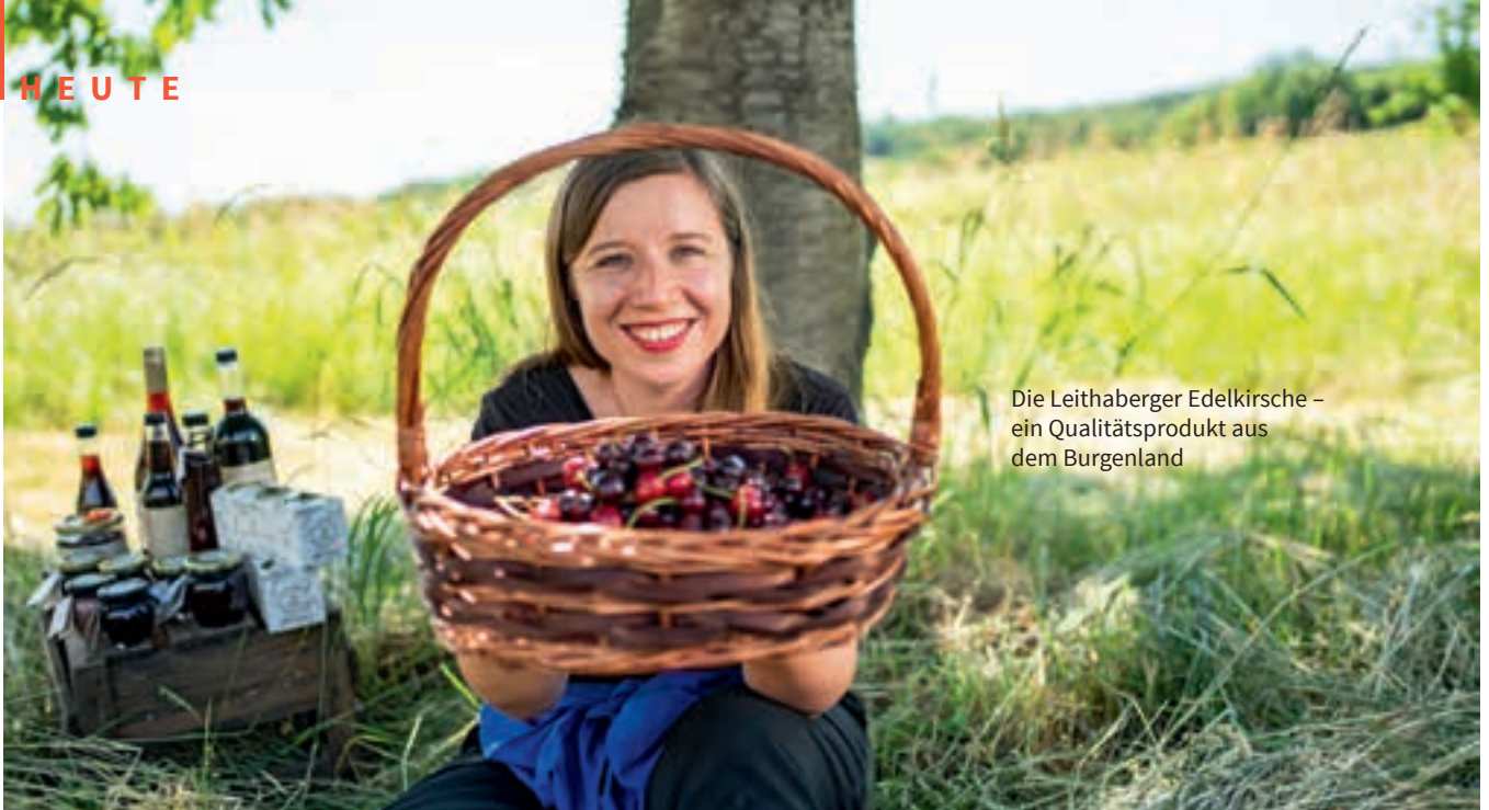
Die Leithaberger Edelkirsche – ein Qualitätsprodukt aus dem Burgenland