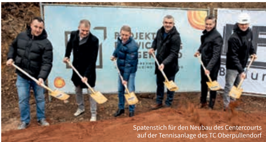
Spatenstich für den Neubau des Centercourts auf der Tennisanlage des TC Oberpullendorf