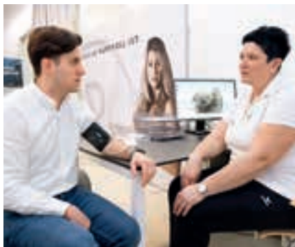
Dem Schritt ins (fast) ewige Eis (oben) geht ein kurzer medizinischer Check (unten) voraus. Dann bezwingt man nacheinander die minus 40 sowie die minus 110 Grad kalte Kammer

Nachforschungen ergaben, waren: eine Kammer, ähnlich einer Kühlkammer beim Fleischer, minus 110 Grad Celsius, mehrere Minuten, toll für den Kreislauf, superneu und hip. Okay. So weit, so gut? Na ja. Schauen wir uns das halt an.