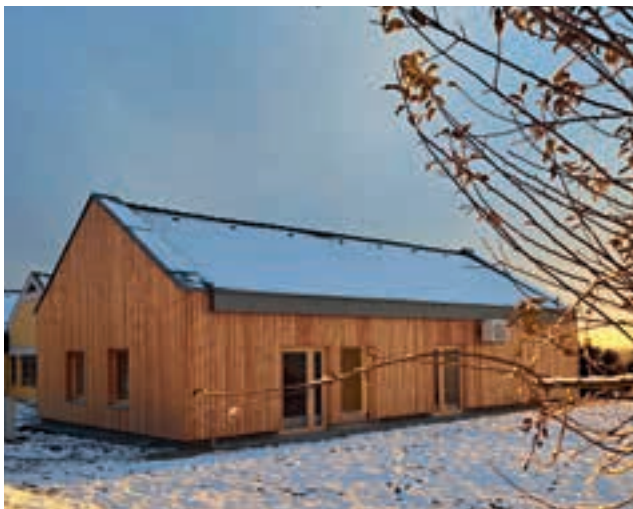
Neue Anlaufstelle: Das Streuobstwiesen-Kompetenzzentrum in Burgauberg-Neudauberg bewahrt, lehrt und kultiviert heimische Obstvielfalt