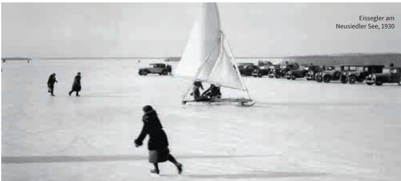
Eissegler am Neusiedler See, 1930