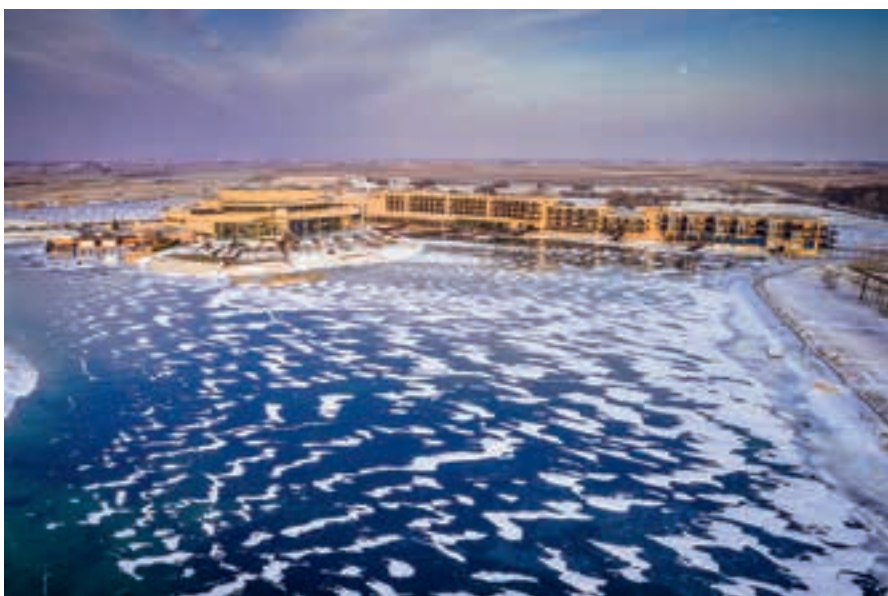
Die St. Martins Therme und Lodge präsentiert sich auch im Winter eindrucksvoll

Hohe Lebensqualität, eine funktionierende Wirtschaft, interessante Jobperspektiven, attraktive Freizeitangebote und eine gescheite Gesundheitsversorgung machen das Burgenland aus. Alles das hat die St. Martins Therme & Lodge in den vergangenen 15 Jahren im Seewinkel gefördert.“