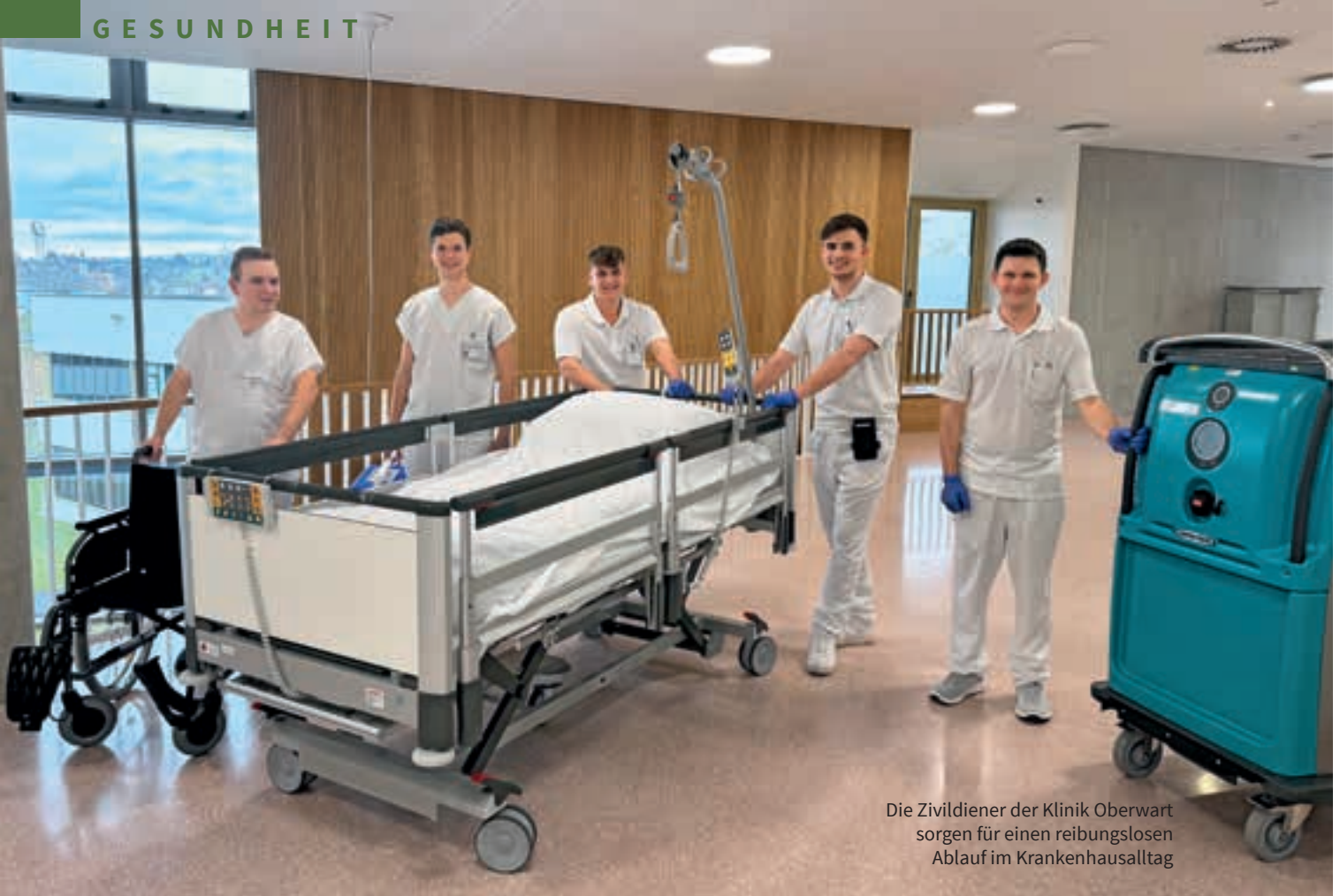
Die Zivildienstler der Klinik Oberwart sorgen für einen reibungslosen Ablauf im Krankenhausalltag