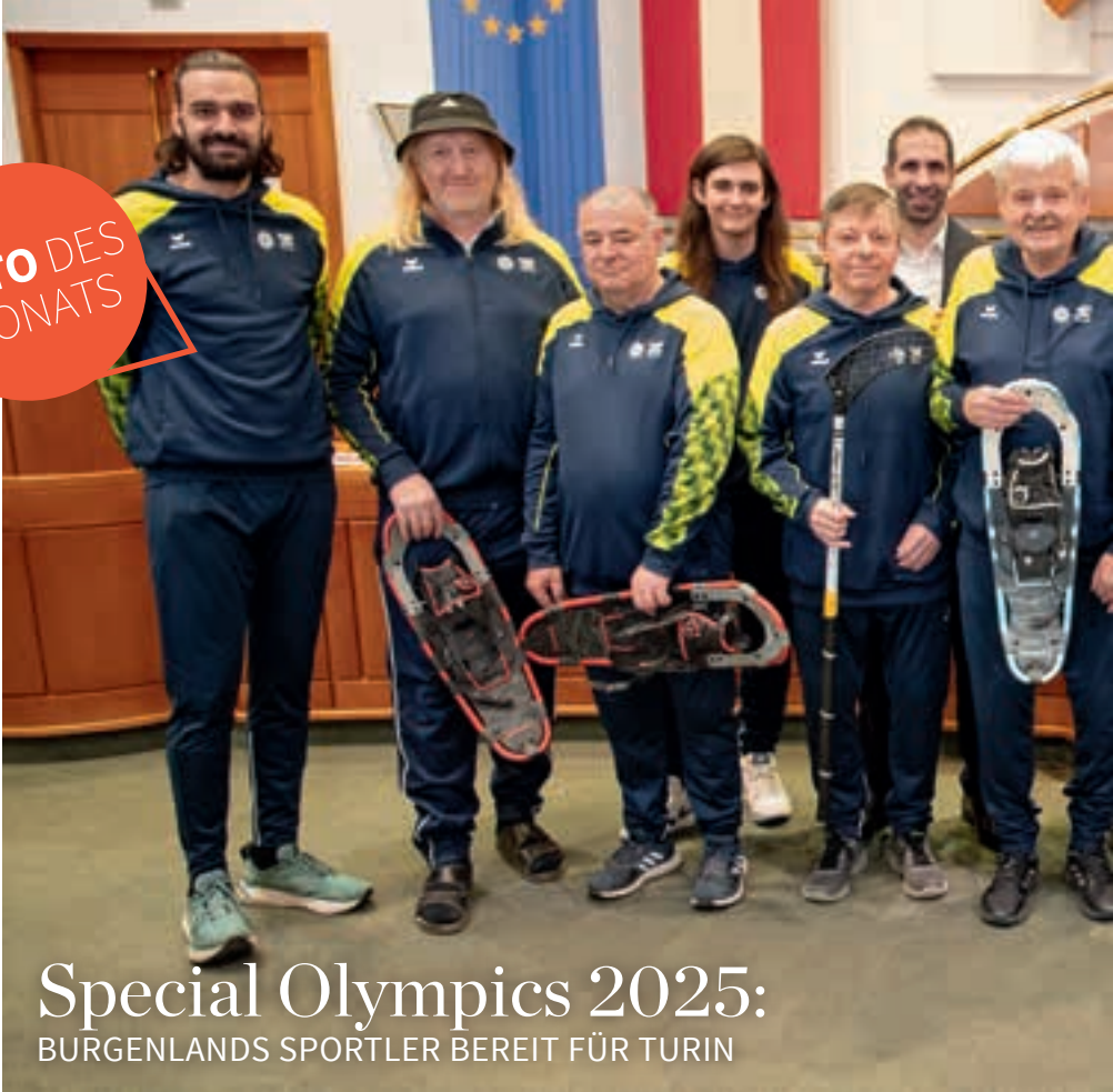
FOTO DES MONATS