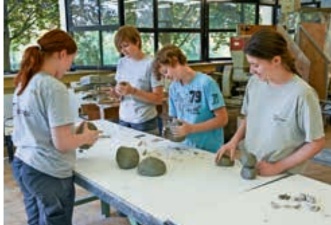
Die Schülerinnen und Schüler der Landesfachschule für Fliese, Keramik und Ofenbau sind die Fachkräfte von morgen