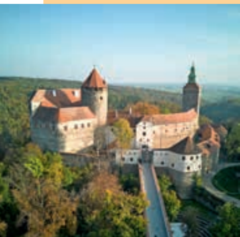
Die Burg Schläining ist der Schauplatz der Friedenskonferenz