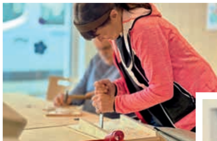
Zum Aktivitäten-Programm gehören beispielsweise das gemeinsame Musizieren oder das Arbeiten in der Holzwerkstatt