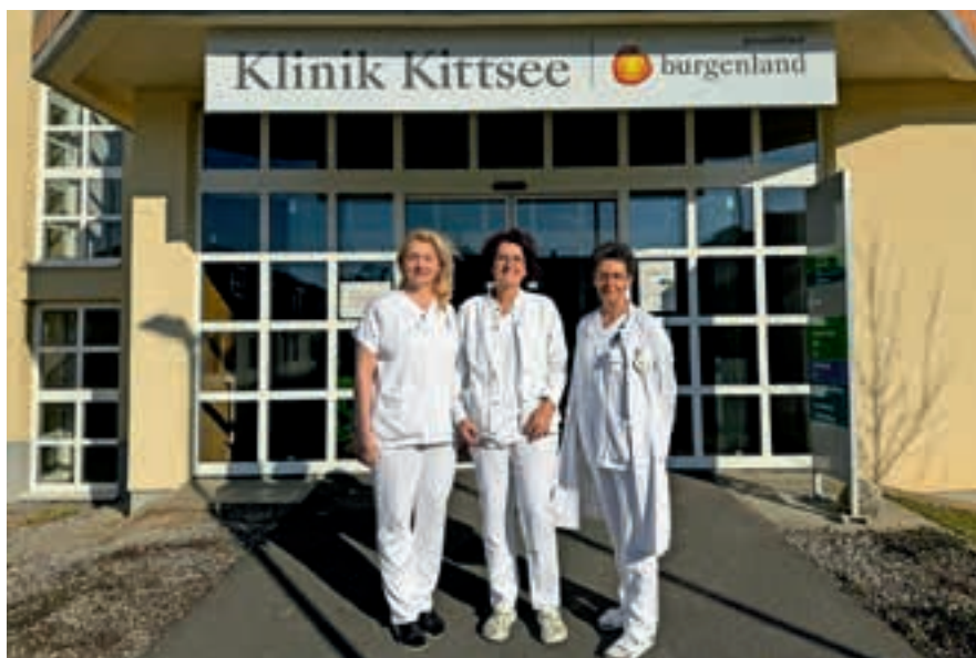
Das Team der Schmerzambulanz der Klinik Kittsee