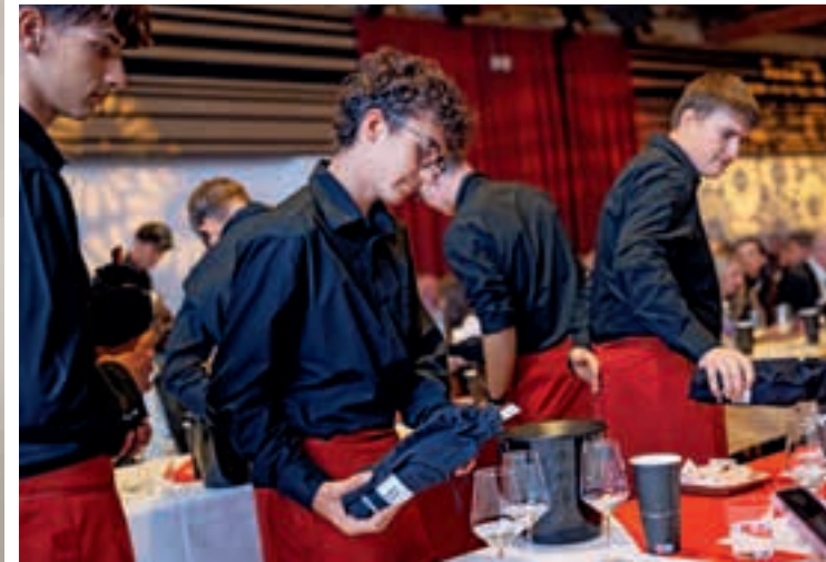
Wein, der verbindet – Regionen und Menschen