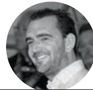
IN VINO VERITAS