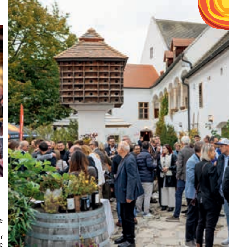
Die Csello Mühle in Oslip – Schauplatz großer Genussmomente