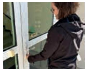
Rechts: Das „finale Zusperrern“ des alten Gebäudes