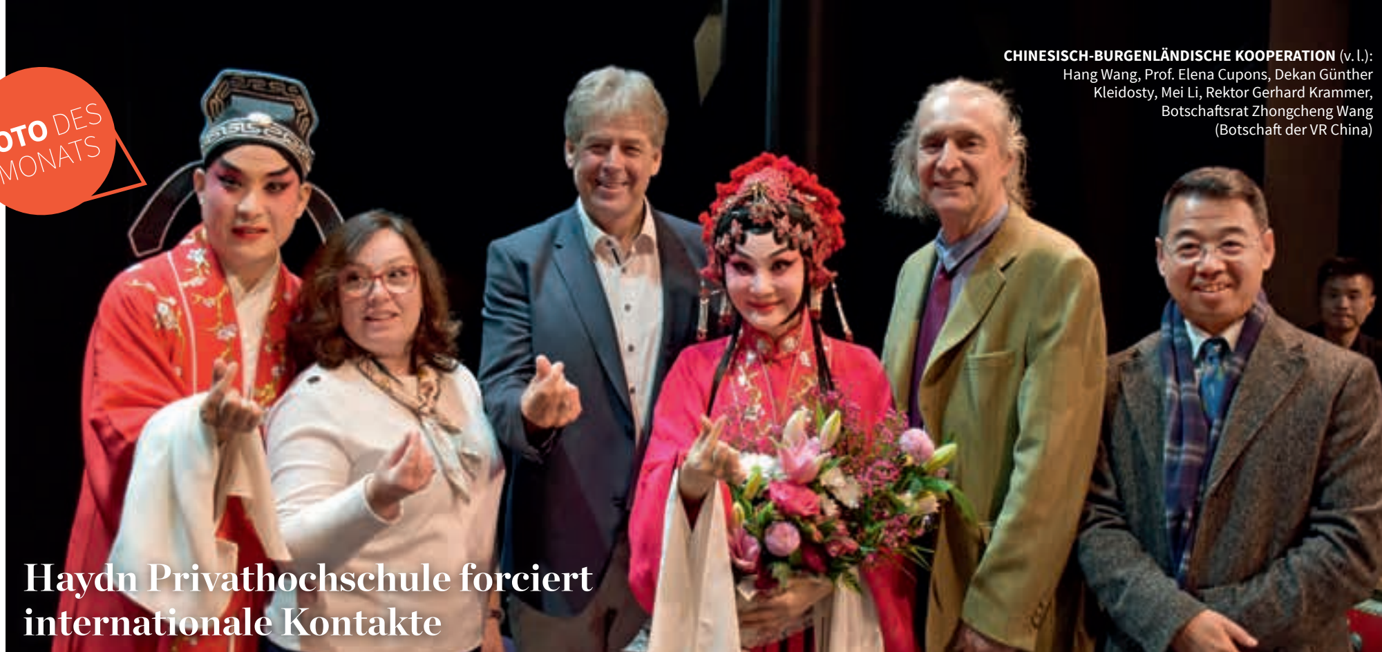
FOTO DES MONATS