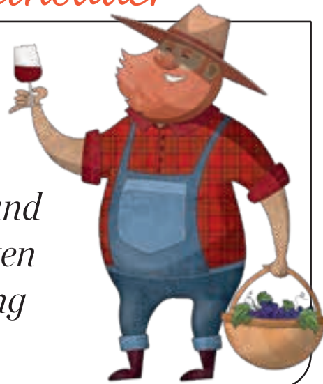
Fotos: JHP, Hochschule Burgenland, Josef Steiger, Illustration: Elena Vinogradova

Der November ist a heiliger Monat: Du lobst den Wein, du ehrst die Gans und host bis Weihnachten a g'segnete Rundung vom Fleiß!