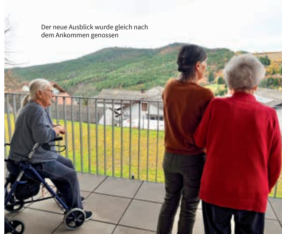
Der neue Ausblick wurde gleich nach dem Ankommen genossen