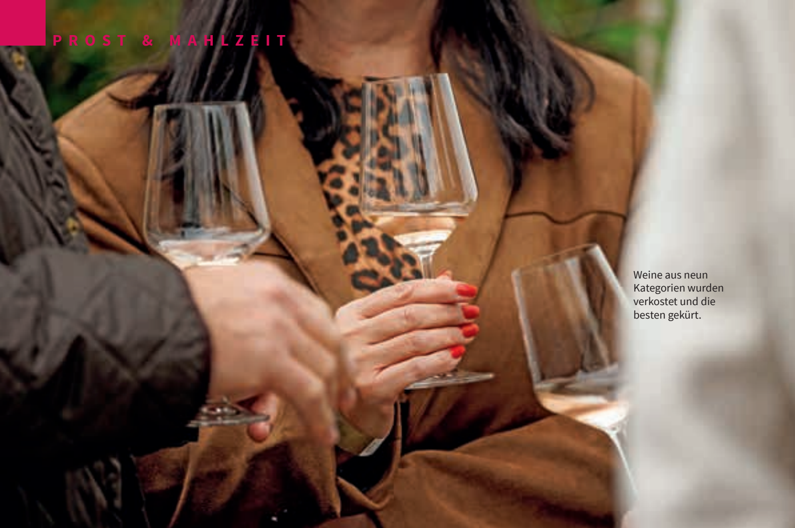
Weine aus neun Kategorien wurden verkostet und die besten gekürt.