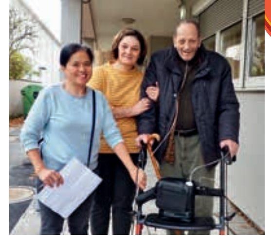
Oben: Viele helfende Hände beim Transport der Bewohnerinnen und Bewohner