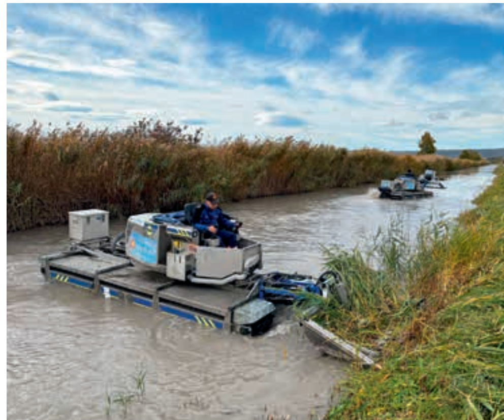
René sorgt mit dem Seemanagement-Team für freie Schilfkanäle und die Entschlammung des Sees