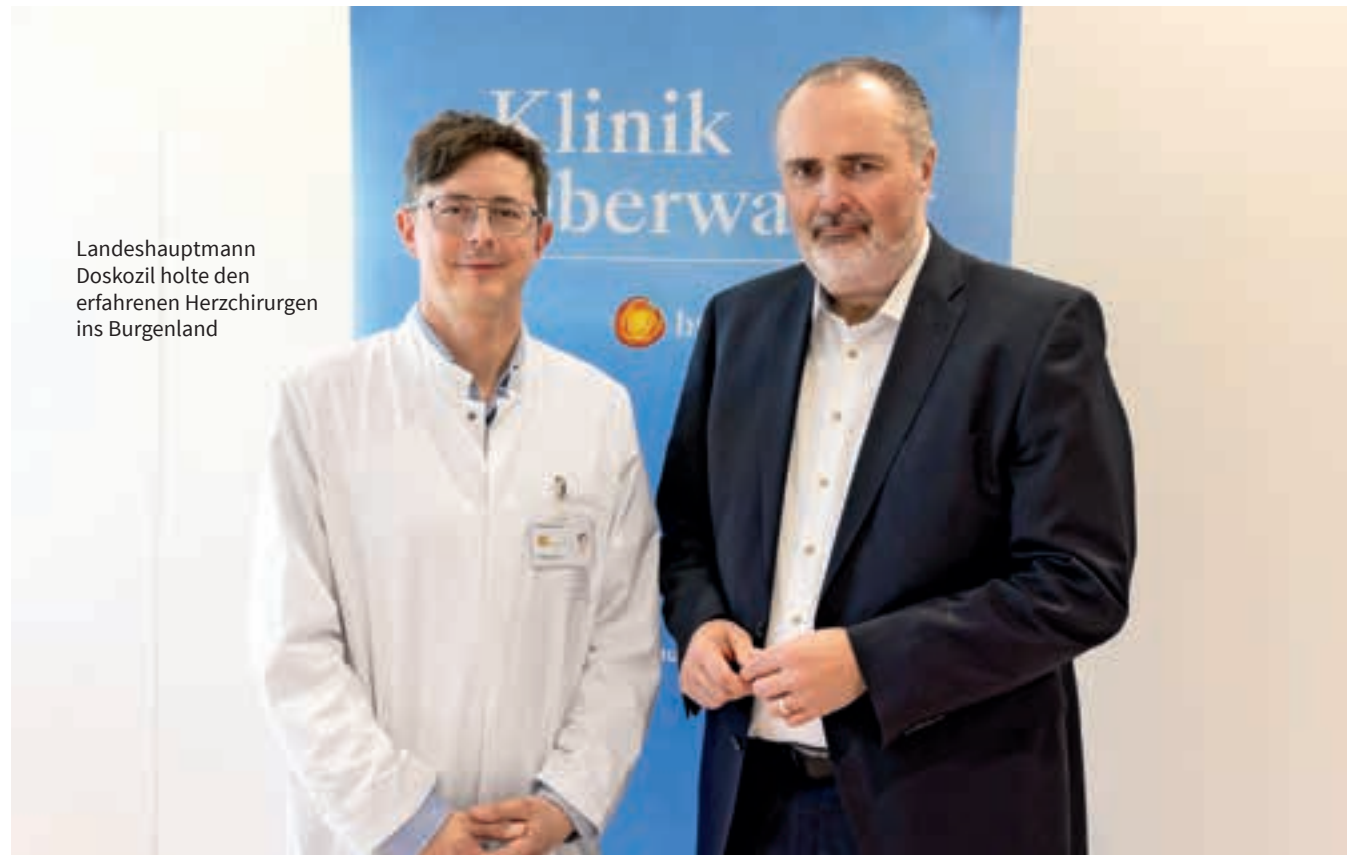
Landeshauptmann Doskozil holte den erfahrenen Herzchirurgen ins Burgenland

Infrastruktur. Gleichzeitig war es auch ein konzentrierter Moment, denn im OP steht immer der Patient im Mittelpunkt.