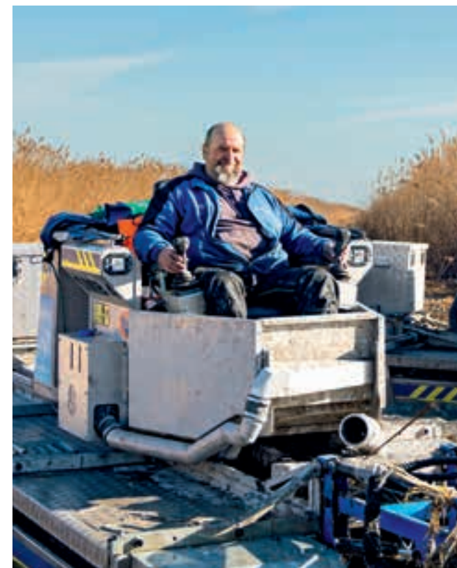
Ein freundliches Gesicht hinter der Arbeit, die man sonst nicht sieht

kein Abfall, sondern zählt offiziell als wertvolles Produkt, das den Böden hilft. Ein regionaler Kreislauf, der so einfach wie genial ist.