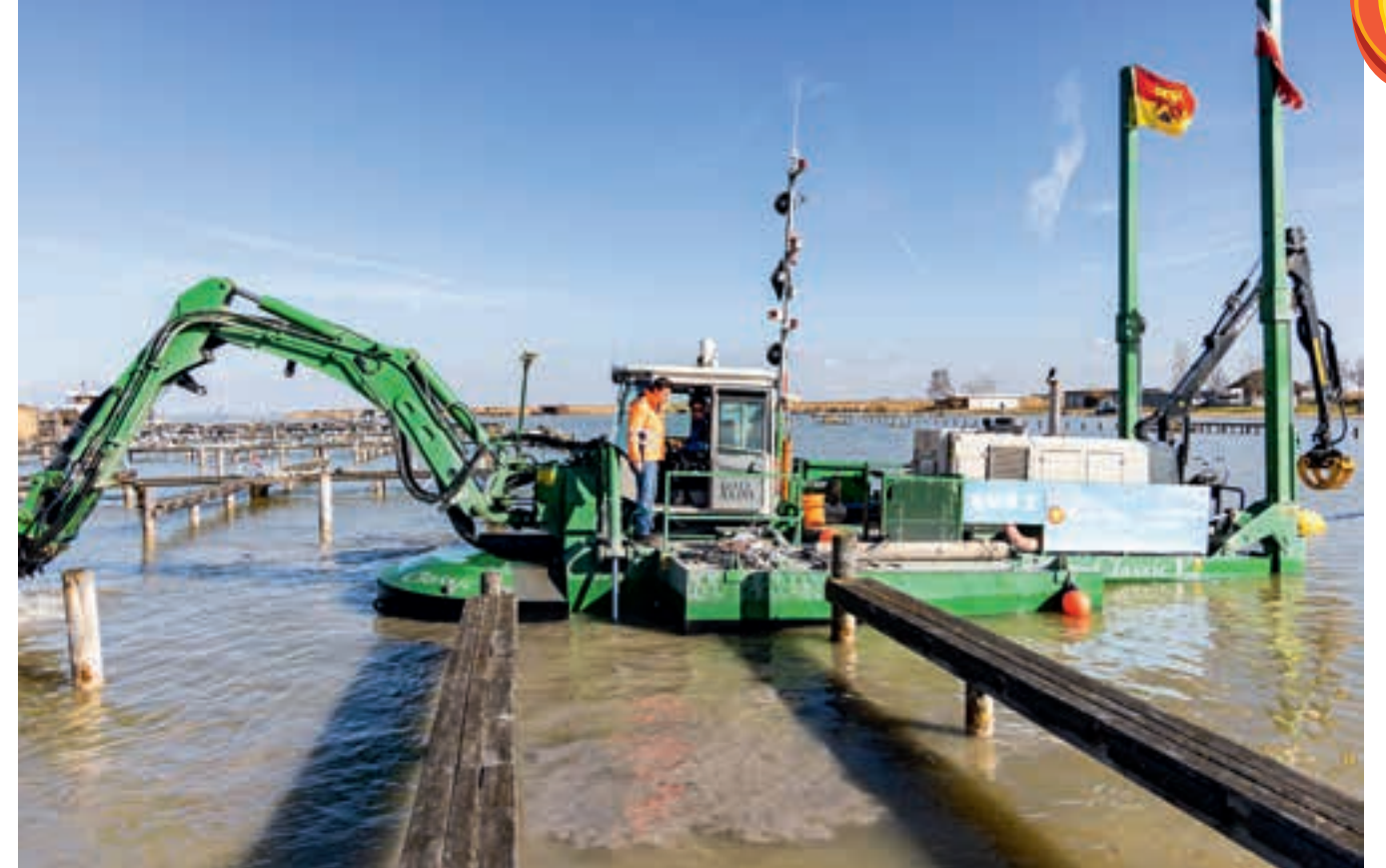
Mit solchen Schwimmbaggern wurden in der heurigen Saison 60.000 m³ Schlamm aus dem See geholt

Rund 60.000 Kubikmeter Schlamm wurden heuer aus dem See geholt. Die Saison läuft von Oktober bis