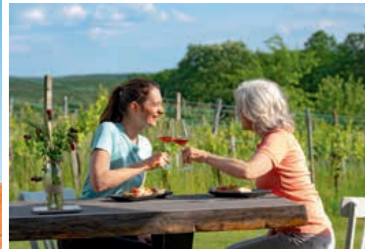
Schritt für Schritt durch das Südburgenland – entlang des Rundwegs laden Buschenschanken und Weingüter zur wohlverdienten Rast ein