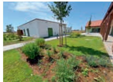
DEUTSCH JAHRNDORF: Die Volkshilfe Burgenland betreibt den neuen Pflegestützpunkt als Hauptstützpunkt für acht Gemeinden im Seewinkel.

Das Herzstück der Reform: Das Burgenland wurde in 28 Pflegeregionen gegliedert. In jeder Region ist nur mehr eine Trägerorganisation für die gesamte nicht stationäre Pflege verantwortlich. Dazu zählen mobile Pflege und Betreuung in den eigenen vier Wänden sowie Tagesbetreuung an den Stützpunkten. Für die Burgenländerinnen und Burgenländer bedeutet das vor allem: klare Zuständigkeiten und weniger organisatorischer Aufwand.