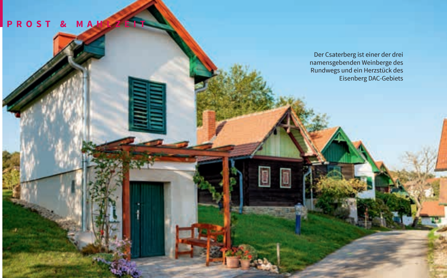
Der Csaterberg ist einer der drei namensgebenden Weinberge des Rundwegs und ein Herzstück des Eisenberg DAC-Gebiets