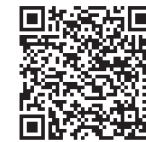
Mehr über Nestor erfahren