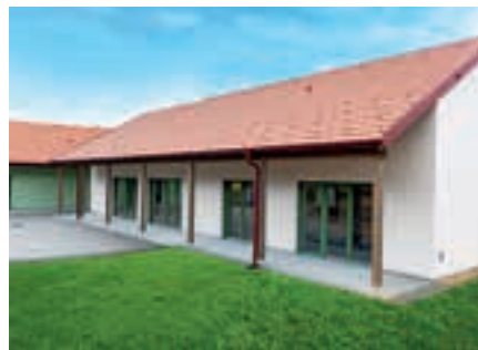
GRAFENSCHACHEN: Die Caritas Burgenland übernimmt den Betrieb des neuen Pflegestützpunktes als Hauptstützpunkt für sechs Gemeinden im Bezirk Oberwart.