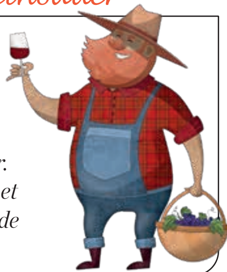
Illustration: Elena Vinogradova

A guate Mutter is wia a alter Weinstock – tief verwurzelt, voller Kraft und bringt jedes Joahr des Beste hervor. Ohne sie war's Leb'n net halb so reich. Ois Guade zum Muttertog!