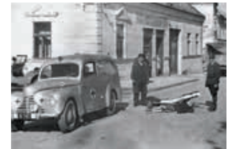
Eine RK-Übung Anfang der 1950er-Jahre