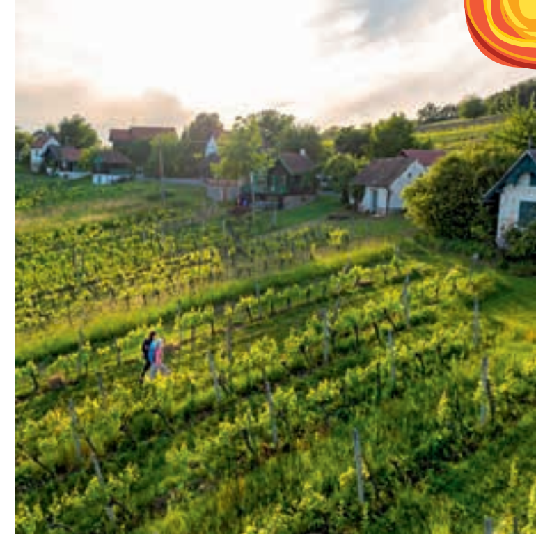
Sanfte Hügel, dichte Wälder und weite Ausblicke: Der Drei Weinberge-Rundweg verbindet Naturgenuss mit burgenländischer Weinkultur