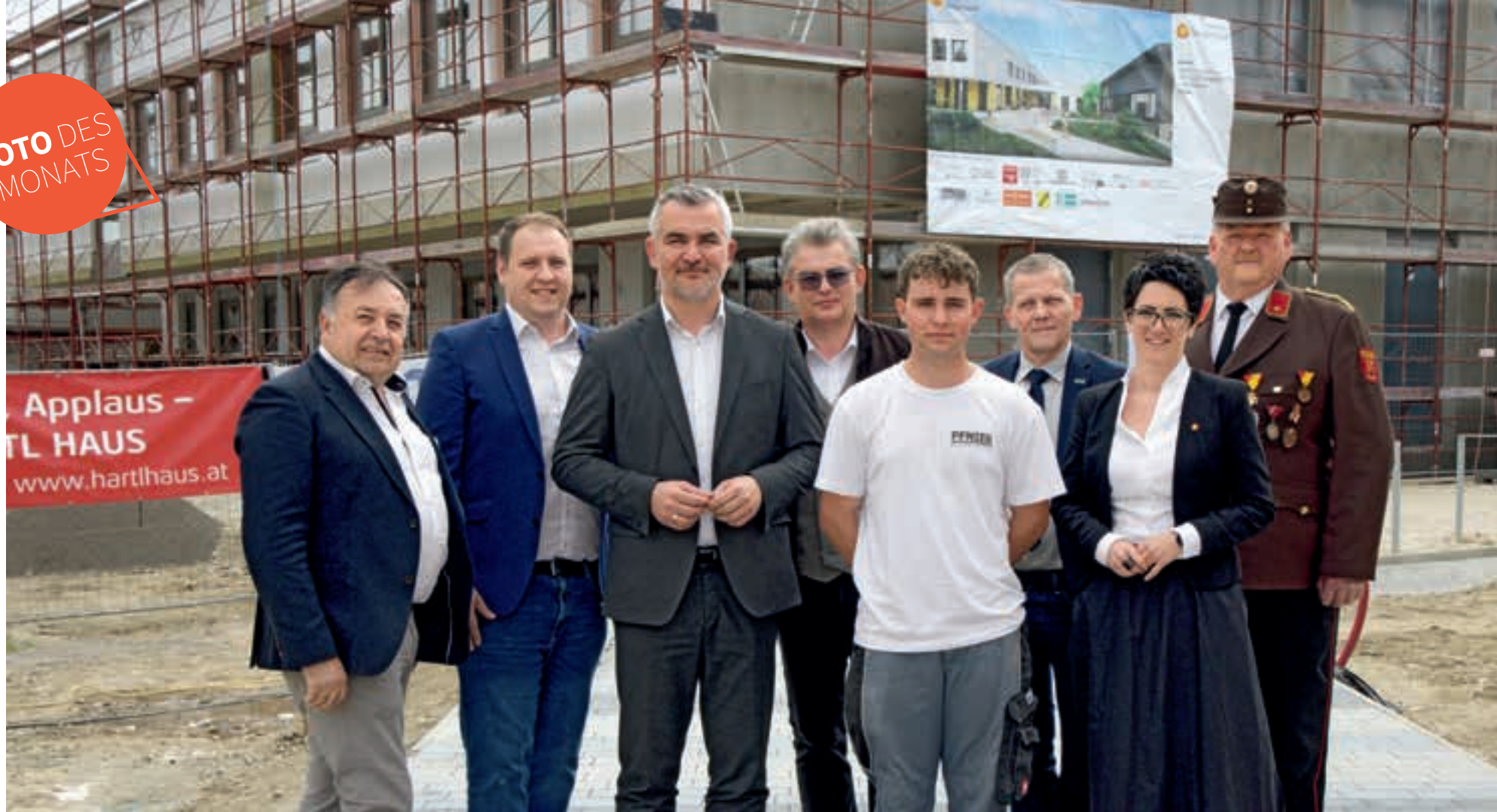
FOTO DES MONATS