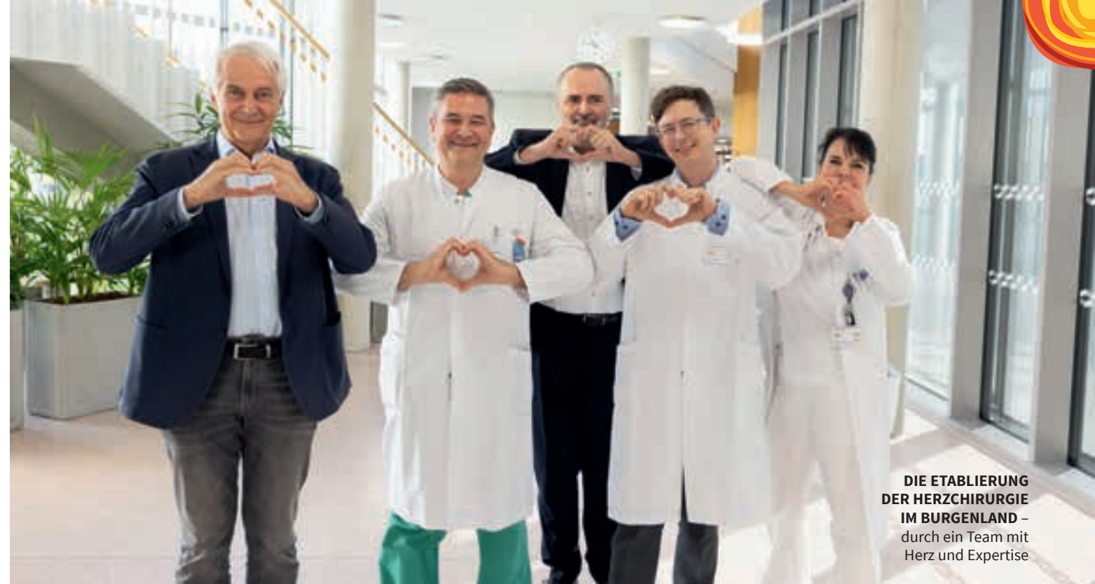
DIE ETABLIERUNG DER HERZCHIRURGIE IM BURGENLAND – durch ein Team mit Herz und Expertise

Bei einem Stich helfen Eiswürfel und Essigwasser gegen Schwellung und Juckreiz.