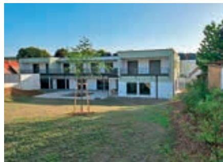
KOBERSDORF: Der erste vom Land neu errichtete Pflegestützpunkt im Bezirk Oberpullendorf wird vom Roten Kreuz Burgenland betrieben.